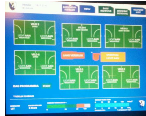
Gebouwd door Strago Electro