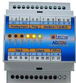
PLC + touchscreen